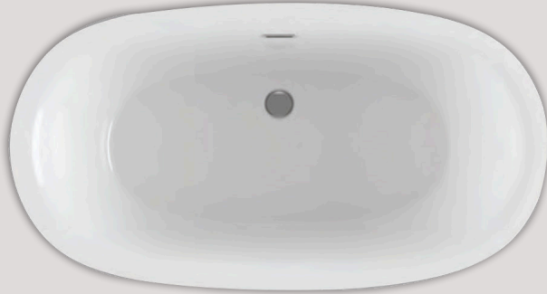
VIBE TULIPA 6033 (AUTOPORTANT)