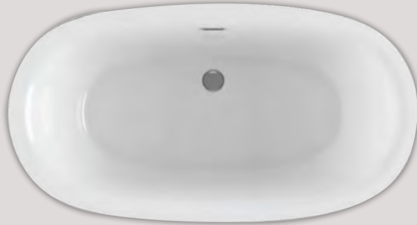
VIBE TULIPA 6033 (AUTOPORTANT)