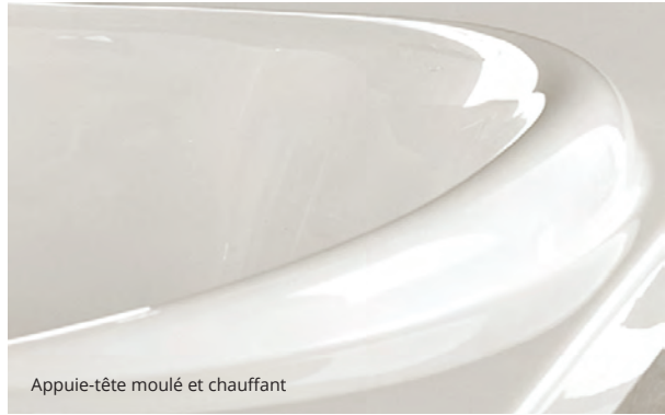
Appuie-tête moulé et chauffant