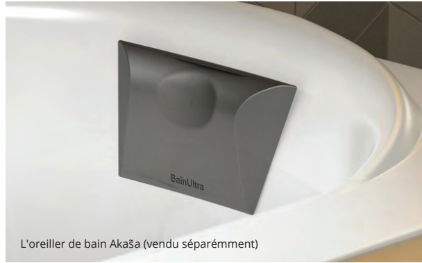
L'oreiller de bain Akaša (vendu séparément)