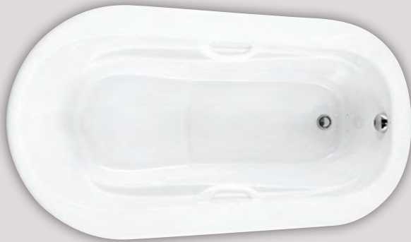
AMMA OVAL 6638