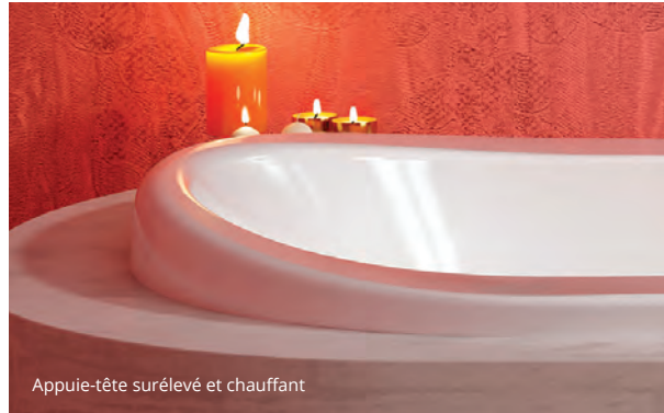
Appuie-tête surélevé et chauffant