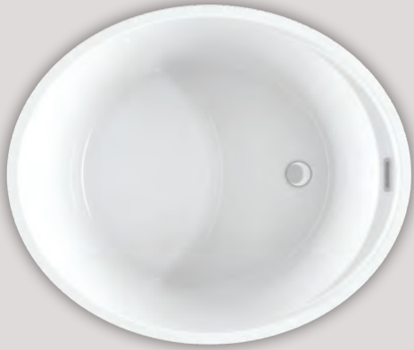
BEONE 4639 (AUTOPORTANT)