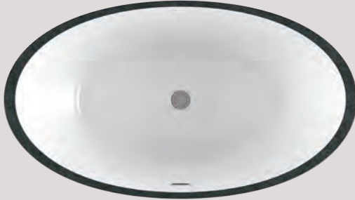
CHARISM OVAL 6436 (AUTOPORTANT)