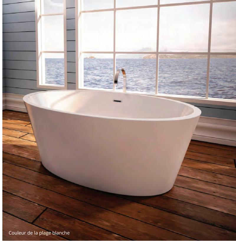
Couleur de la plage blanche