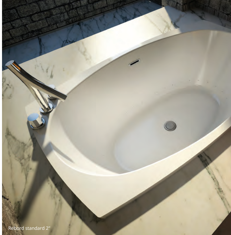
Rebord standard 2"