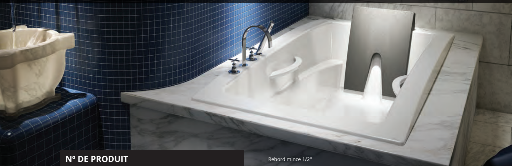
Rebord mince 1/2"

Dans la spiritualité inuit, Inua signifie : tout ce qui vit. Il s'agit de l'âme qui lie toutes choses appartenant à la nature.