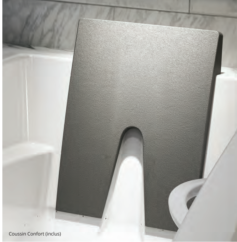
Cousin Confort (inclus)