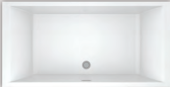
NOKORI 6935 (AUTOPORTANT)