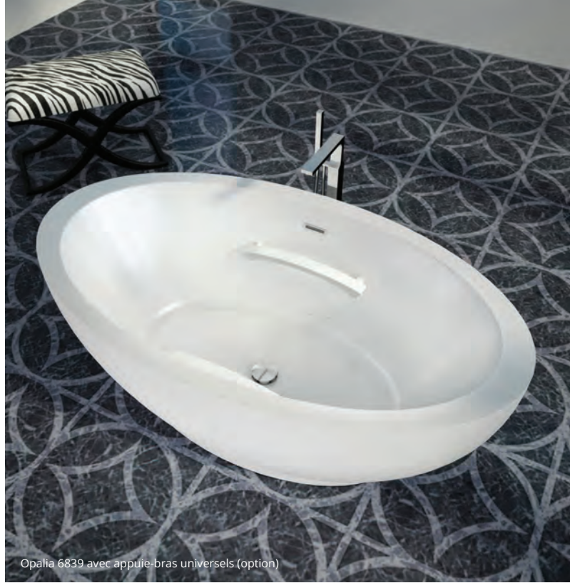
Opalia 6839 avec appuie-bras universels (option)