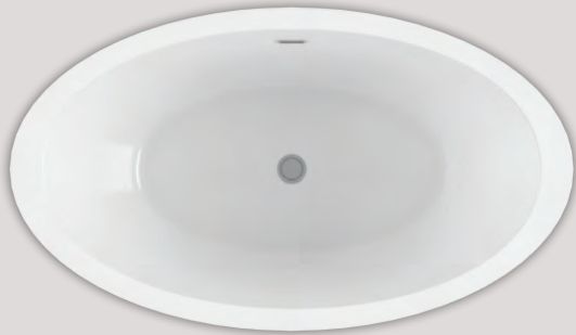
OPALIA 6839 ELLIPSE CENTRÉE (AUTOPORTANT)