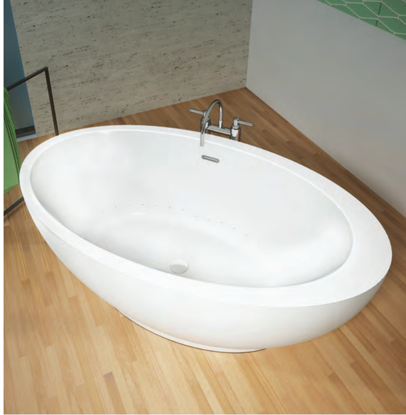
OPALIA 6839 ELLIPSE DÉCENTRÉE - GAUCHE (AUTOPORTANT)