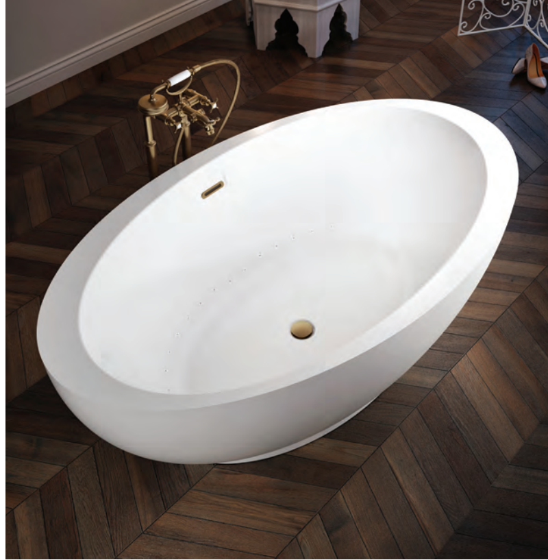
OPALIA 6839 ELLIPSE OBLIQUE - GAUCHE (AUTOPORTANT)