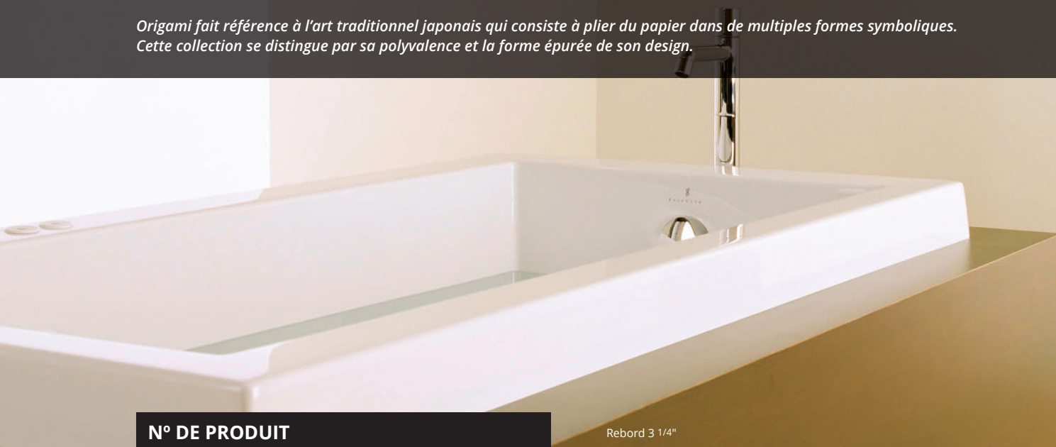
Rebord 3 1/4"

Origami fait référence à l'art traditionnel japonais qui consiste à plier du papier dans de multiples formes symboliques. Cette collection se distingue par sa polyvalence et la forme épurée de son design.