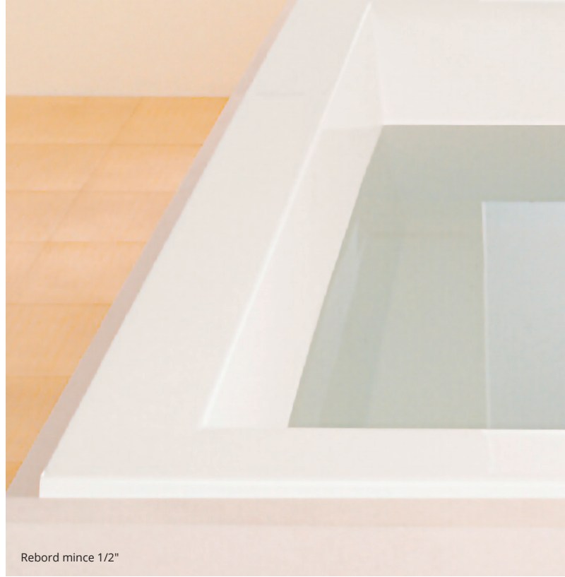
Rebord mince 1/2"