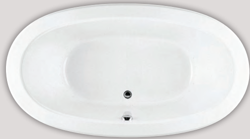
CELLA 6636 (AUTOPORTANT)