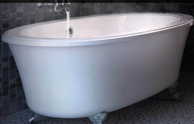
Avec rebord plat

Balnéo se définit simplement par l'art de prendre un bain. Pour BainUltra, l'importance de prendre un bain s'inscrit dans l'art de vivre qui consiste à ralentir et à prendre du temps pour soi.