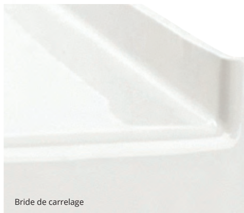
Bride de carrelage