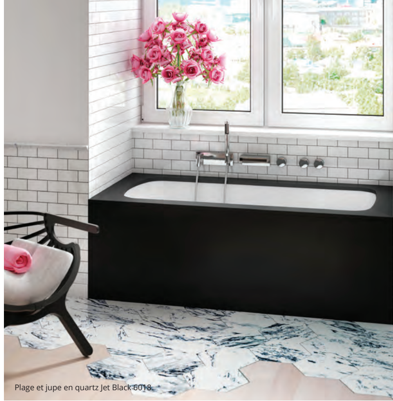
Plage et jupe en quartz Jet Black 6018