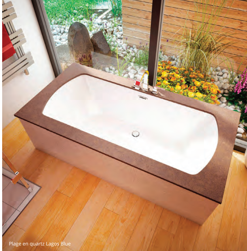
Plage en quartz Lagos Blue