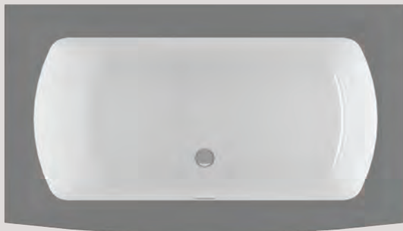
MONARCH 6638F PLAGE ARRONDIE – AVANT