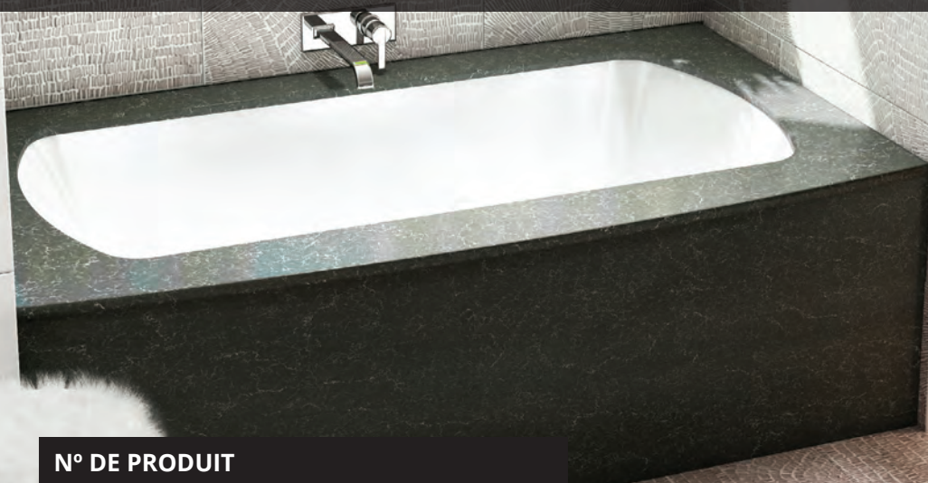
Plage et jupe en quartz Piatra Grey

Monarch est une collection de bains thérapeutiques aux accents riches et aux notes pures, émanant de ses exquises plages faites de quartz.