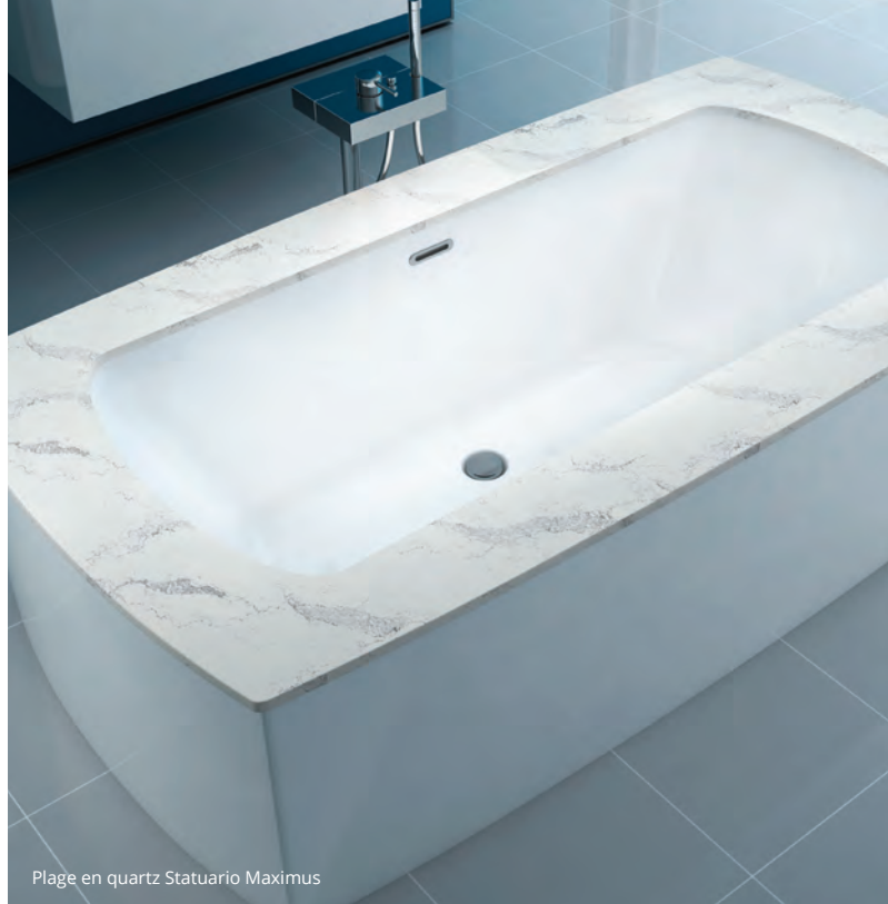
Plage en quartz Statuario Maximus