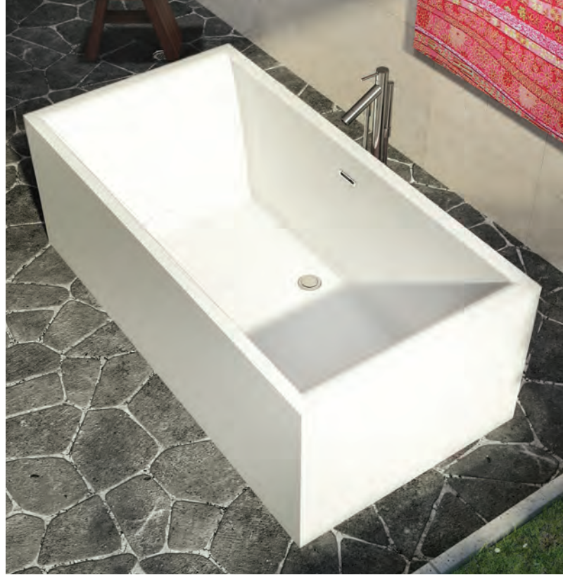
NOKORI 6935 (AUTOPORTANT)