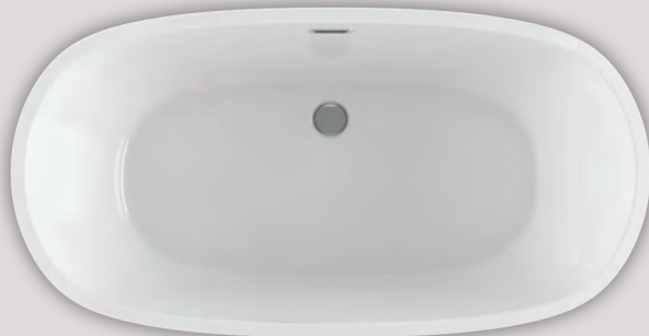
VIBE OVAL 5830 (AUTOPORTANT)